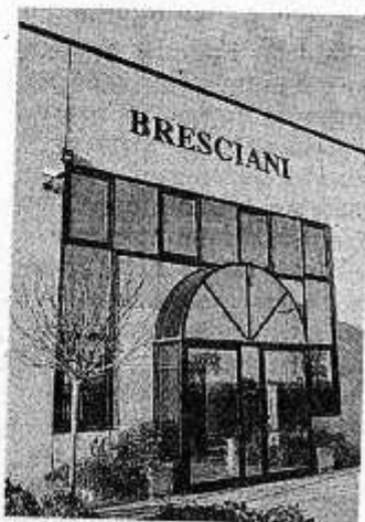
Il calzificio Bresciani a Spirano